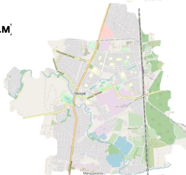
схема с ближайшей транспортной инфраструктурой